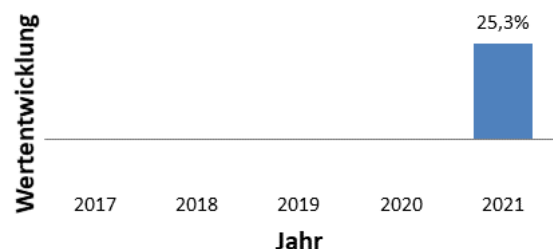
Vergangene Wertentwicklung in EUR

Weitere Informationen die Kosten betreffend finden Sie im Kapitel "Kosten" des Fondsprospektes, welches unter www.structuredinvest.lu abrufbar ist.